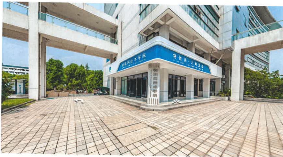
（图）物联网技术学院 VR 导航

回望 2022 年，校企双方在专业群人才培养模式改革、1+X 证书制度试点工作、卓越人才培养、科研和科技服务、工匠精神传承等方面取得了显著成效。总结 2022 年，双方在更多层面展开合作，发挥各自优势，完成新大陆产业学院的落地工作，引进了行业优质企业资源，以产业学院为载体，及时把新技术、新工艺、新规范转换为教学资源，促进了专业及教学内容的持续发展。