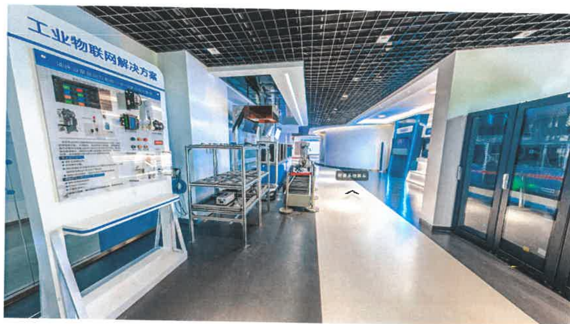
（图）产业学院落地项目