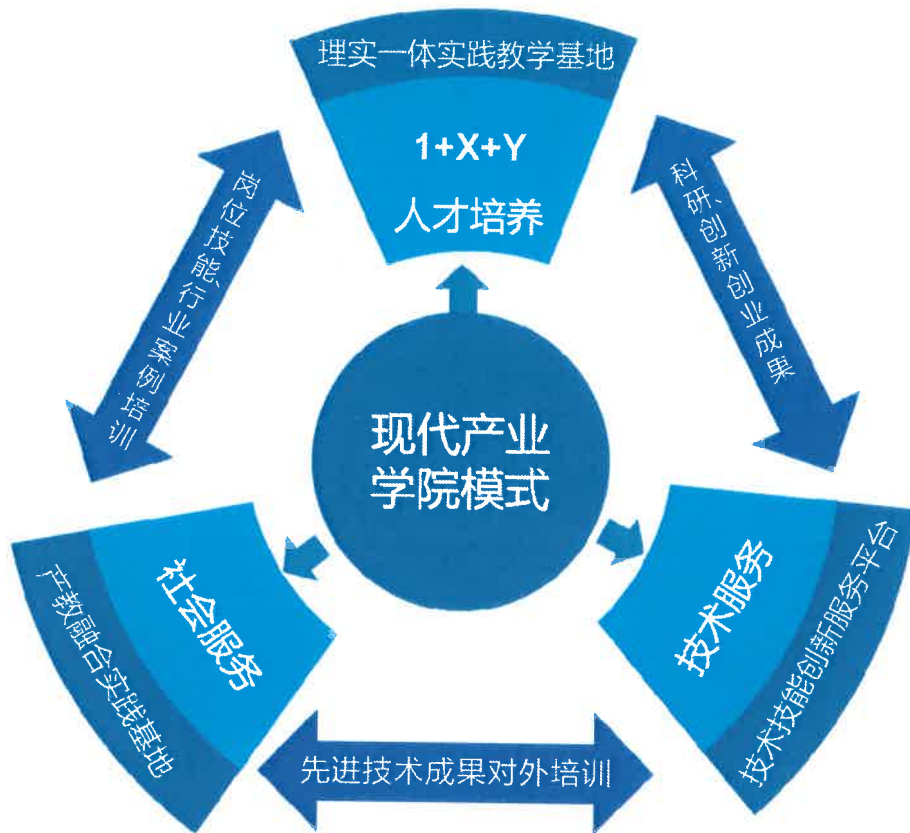
(图) “三位一体”现代产业学院