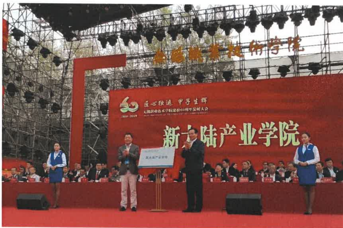
（图）校企双方签署揭牌

依据协议，校企合作重点围绕校方物联网技术学院的物联网技术专业群，合作领域涵盖专业群人才培养模式改革、1+X证书制度试点、卓越人才培养、科研和科技服务、工匠精神传承等。