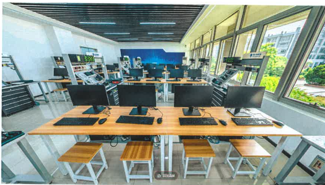
（图）工业数据采集与边缘计算实训室