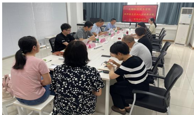
图5 朗新科技集团股份有限公司参与人才培养方案的制订讨论

朗新科技集团股份有限公司每年派技术负责人或人事负责人参加软件技术专业人才培养方案制订会议。公司派人员参加了会议，听取了专业负责人对于专业建设情况的汇报，参观了学校专业建设新设施设备，并结合公司对人才的需求配合学校填写了人才需求调查问卷，对人才培养的目标、人才培养的计划、以及人才培养的实施都提出建设性的意见和建议。校企共同制定了专业的人才培养方案，使学生具备在软件开发、软件实施等岗位的迁移能力。