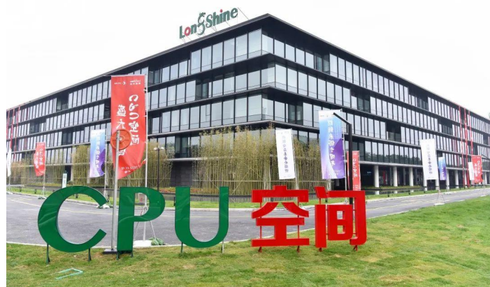
图 1 朗新科技集团股份有限公司 CPU 空间基地

朗新科技为全国 1.2 万多家政企客户、3.9 亿多大众家庭用户长期提供技术与运营服务，助力产业转型升级、持续提升用户体验。2021 年，公司实现营业收入 46.39 亿元，同比增长 37%；实现归属于上市公司股东的净利润为 8.47 亿元，同比增长 20%；过去 10 年复合增长率分别为 43%、48%。