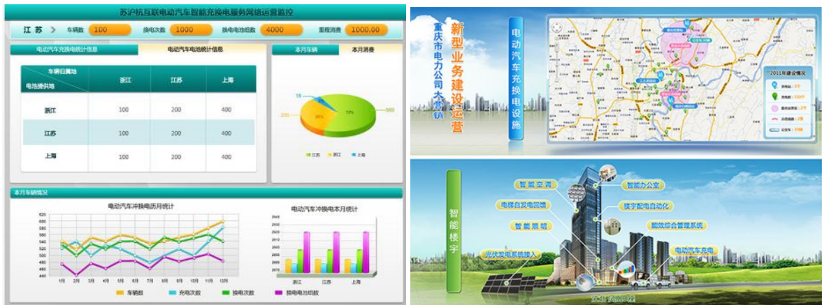
图 6 朗新科技集团股份有限公司软件产品