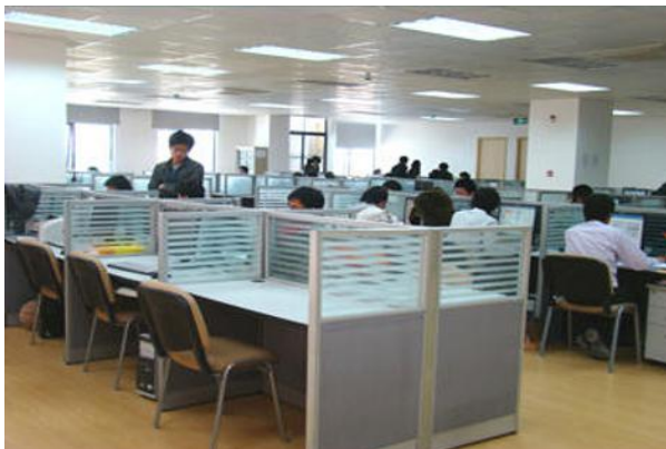
图4 软件技术专业学生在朗新科技集团股份有限公司实习

在朗新科技集团股份有限公司建立专业校外实训基地，学校以企业为中心安排顶岗实习活动（图4）。朗新科技集团股份有限公司按照学校教学计划，结合单位实际情况，安排学生实习内容，指导实习过程，培养学生实际操作能力和职业素养。