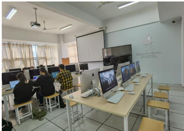
图3 无锡职业技术学院项目开发 with iOS 创新实训室